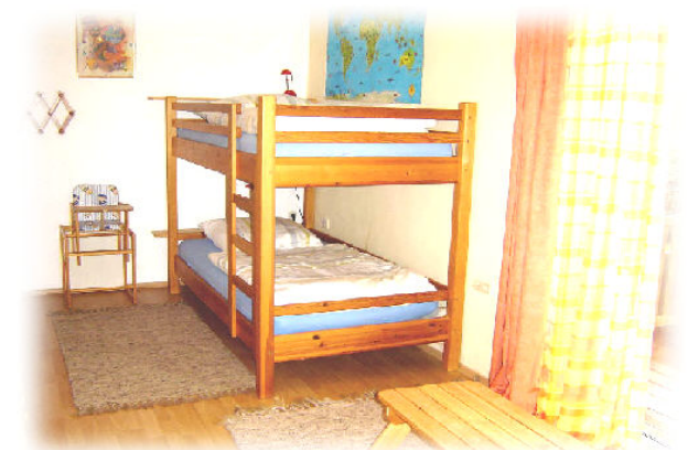
Das 2. Schlafzimmer