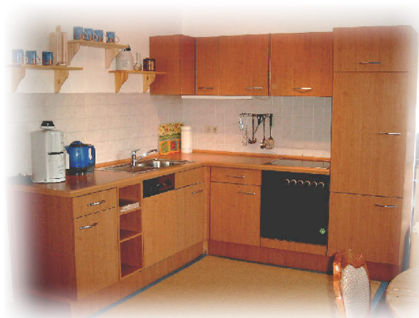
Die voll eingerichtete Einbauküche