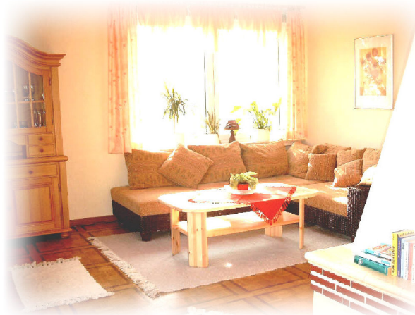
Das 25qm große Wohnzimmer