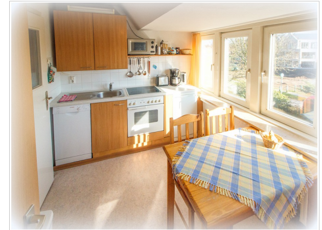
Die voll eingerichtete Küche