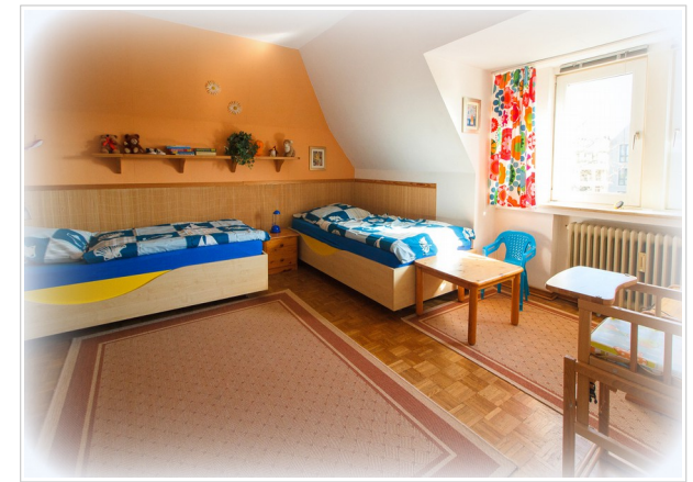
Das 2. Schlafzimmer