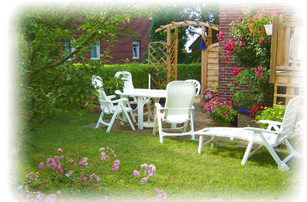
Der Garten mit Südterrasse