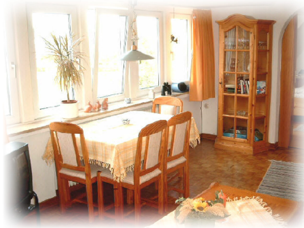
Die Essecke mit Blick auf die Nordsee