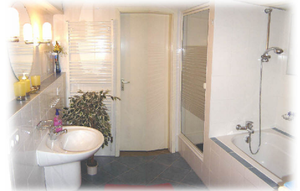
Das moderne Badezimmer