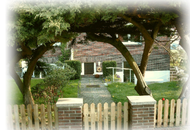
Eingang u. Garten der Wohnung