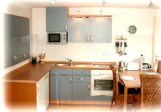
Die voll eingerichtete Einbauküche