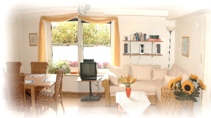
Das 30qm große Wohnzimmer